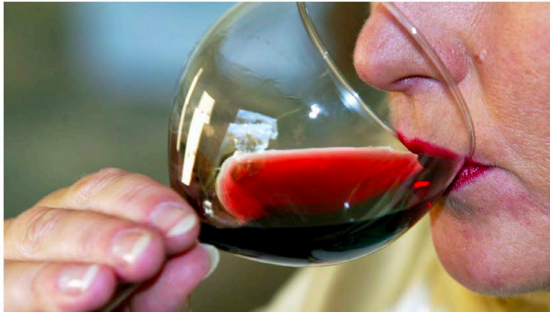
RØDVIN HVER DAG: Mange eldre har et høyt alkoholforbruk.

Hjemmetjenesten opplever ofte at eldre er beruset når de kommer på besøk.