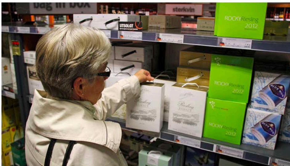
Mange voksne barn som opplever at mor eller far utvikler alkoholproblemer i 50 - 60-årene.

– Vi gikk på tå hev. Vi visste aldri hvordan mamma ville oppføre seg, sier «Maria». Mange voksne barn opplever at mor eller far utvikler alkoholproblemer i 50-60-årene.